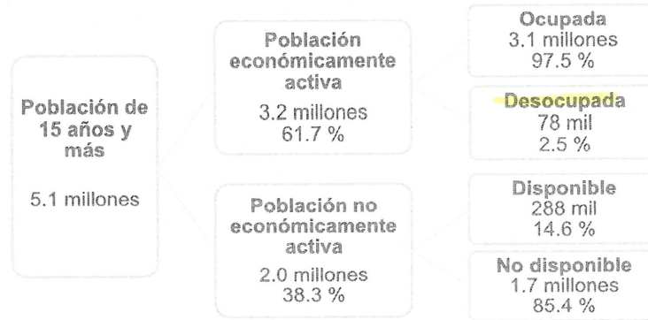
Diagrama 1 Distribución de la población en edad de trabajar tercer trimestre de 2025